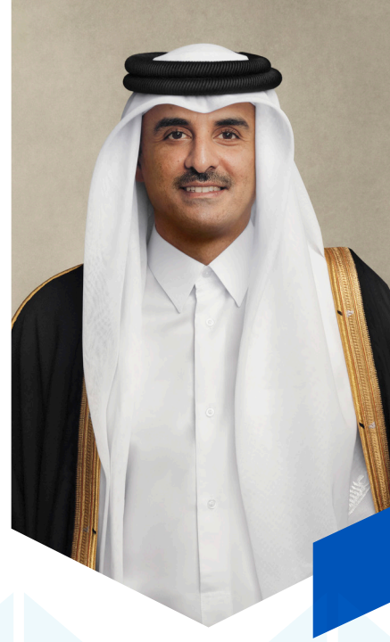
حضرة صاحب السمو الشيخ تميم بن حمد آل ثاني أمير دولة قطر