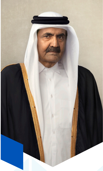
حضرة صاحب السمو الأمير الوالد الشيخ حمد بن خليفة آل ثاني